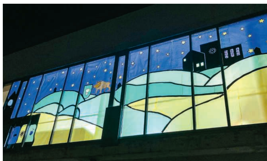
Fensterbild der Fünft- und Sechstklässler

Seit dem 1. Dezember kann bis an Heiligabend jeden Abend, ab 18.30 Uhr, ein selbst gestaltetes Adventsfenster bestaunt werden. Die einzelnen Standorte sind unter birnenstorf.ch abrufbar.