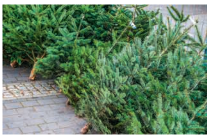
Die Nadelbäume liegen bereit

Am 29. und 30. Dezember und vom 2. bis 4. Januar ziehen die Sternsinger-Kinder in Begleitung von Erwachsenen wieder durch das Dorf und bringen Freude, Licht und Segen in die Häuser und Wohnungen. Damit dieser alte Brauch durchgeführt werden kann, sucht das Sternsinger-Team Kinder ab der ersten Klasse, die Zeit und Lust haben, als König, Sternträger oder Kasselträger mitzumachen. Das kann an einem oder an mehreren Abenden sein. Gleichzeitig werden Eltern gesucht, die einmal oder mehrmals eine Sternsinger-Gruppe begleiten. Jeden Abend nach dem Sternsingen werden alle Teilnehmenden im Don-Bosco-Saal mit einem kleinen Abendessen und einem Batzen belohnt. Interessierte melden sich bei Monika Maurer (056 225 14 44, 079 634 27 34, mu.maurer@bluewin.ch) oder Claudia Zehnder (056 225 27 25, 079 840 37 48).