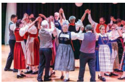
Tanzen in der Gemeinschaft

Einer Tradition folgend, gibt die Ortsbürgergemeinde jedem Birmenstorfer Haushalt für einen symbolischen Betrag von fünf Franken einen Weihnachtsbaum ab. Holen Sie sich Ihren Tannenbaum am Samstag, 20. Dezember, zwischen 8.30 und 11.30 Uhr schnittfrisch im Wald ab - Parkplatz Tannwald, Fislisbacherstrasse. Gegen klamme Finger und kalte Füsse stehen wärmende Getränke, heisse Wienerli und frische Kuchen bereit. Zudem helfen die Mitglieder der Ortsbürgerkommission bei der Auswahl und verpacken den Baum transportgerecht.