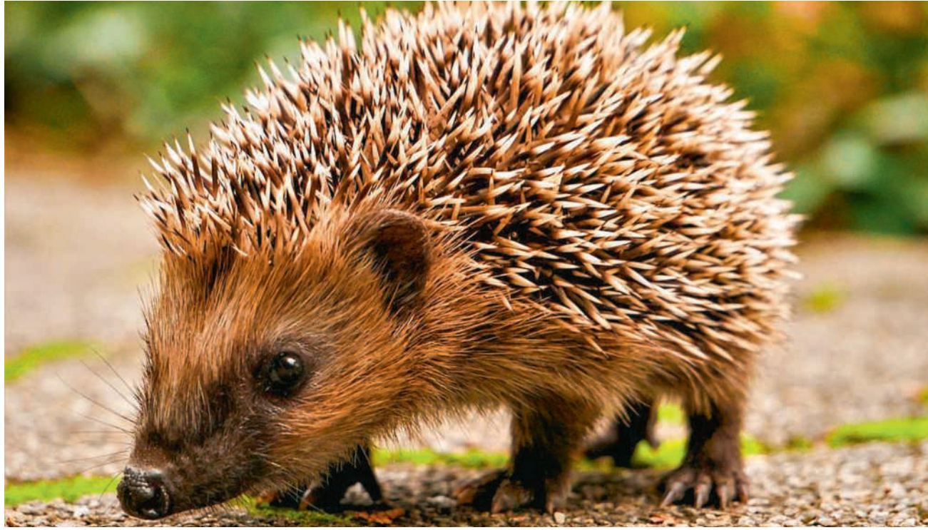
Igel und andere Wildtiere sind im Winter auf einen sicheren Unterschlupf angewiesen

Ein klassischer Laub- oder Reisighaufen in einer ruhigen Ecke bietet Igel, Kröten oder Insekten Schutz vor Kälte. Totholz- und Steinhäufen sind zusätzlich Lebensraum für Eidechsen,