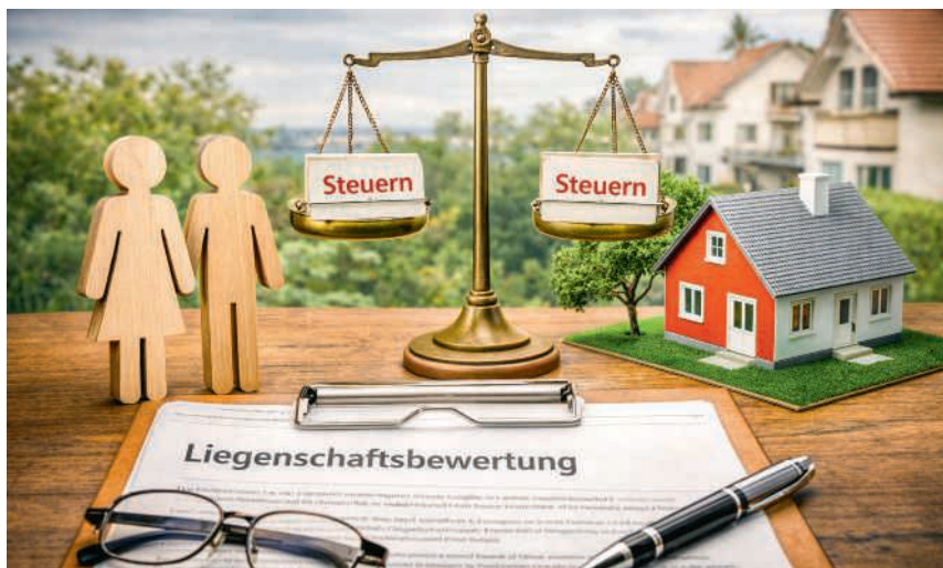
Das Stimmvolk hat den Weg vorgegeben, es gilt aber noch vieles zu regeln

Am 28. September 2025 wurde auf Bundesebene zudem der Wegfall des