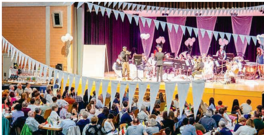
Ein Unterhaltungskonzert mit wilden Piraten

Anschliessend wurde in geselliger Runde angestossen, diskutiert und gelacht - ein gelungener Abend, der zeigte, wie lebendig das Birmenstorfer Gewerbe auch nach 40 Jahren noch ist.