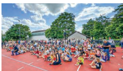
Warten auf den Start

2026 lädt die Gemeinde alle Einwohnerinnen und Einwohner wieder ein, sich bewusst zu bewegen. Birmenstorf ist dieses Jahr erneut beim Coop-Gemeinde-Duell von «Schweiz bewegt» am Start und beteiligt sich mit rund 200 anderen Gemeinden am grössten nationalen Programm zur Förderung von mehr Bewegung. Dabei kann wie in den letzten Jahren jede und jeder anonym Bewegungsminuten sammeln und Birmenstorf im Wettkampf gegen andere Gemeinden nach vorn bringen. Wichtig für alle, die bereits in den letzten Jahren teilgenommen haben: Die App von 2025 muss deinstalliert werden. Neu sammelt man Minuten mit PC, Tablet oder Handy direkt über coopgemeindeduell.ch.