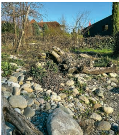
Naturgarten in Birmenstorf