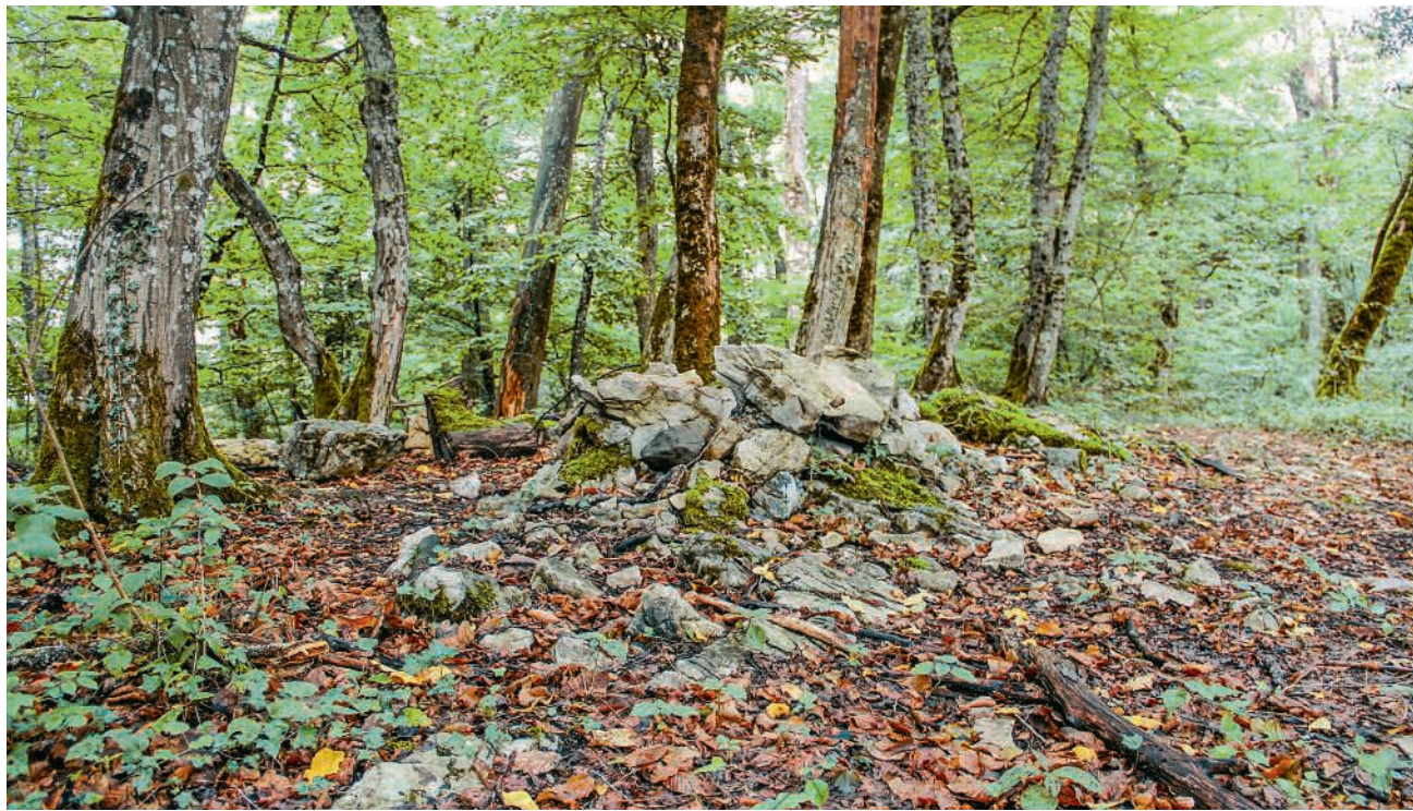
Beim «Alten Schloss» ragen Kalksteine aus dem Boden. Mauerreste der Burg des Raubritters Netti?

«Stockdunkel war die Nacht. Der alte Wächter Sigurd stand auf der zinnenbewehrten Turmspitze. Er starrte in die Finsternis hinaus. Schutzlos war er dem Unwetter ausgesetzt. Tiefes Donnern grollte, unaufhörlich. Verästelte Blitze fuhren in die Erde. Begleitet von Wassermassen. Der Wind peitschte um seinen Turm. Sigurd fühlte, dass sich das Unwetter immer mehr der Burg näherte. Ein eigenartiger Geruch lag in der Luft. Ihn fröstelte. So stellte er sich den jüngsten Tag vor. Blitz und Donner und Schwefelgestank. Mit einem Male bekam er Angst. Grosse Angst. Ob ihn der Teufel diese Nacht holen würde? Ob sie nun alle bezahlen mussten für ihre Schandtaten? Er und die anderen, die zum Gefolge von Netti, dem Raubritter, gehörten. Bilder zogen vor seinen Augen vorbei. Schreckliche Bilder. Hoch zu Ross waren sie durch Saatfelder galoppiert, Ernten hatten sie niedergebrannt, Häuser. Wer zu Martini nicht bezahlte, wurde in den Turm geworfen und erblickte nie mehr das Tageslicht. Frauen und Kinder, die für den Ehemann und den Vater um