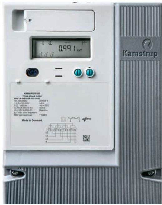
Neue Strom- und Wasserzähler der Firma Kamstrup

Aus der öffentlichen Ausschreibung ging die Firma CKW AG als Siegerin hervor. Die CKW AG hat bereits mehr als 180 000 Smart-Meter im Einsatz. Es werden Smart-Meter des dänischen Herstellers Kamstrup eingesetzt. Diese kommunizieren über eine Funktechnologie, bei der sich die Zähler untereinander vernetzen und die verschlüsselten Daten weiterleiten. Dadurch entsteht ein stabiles, flexibles und energieeffizientes Kommunika-