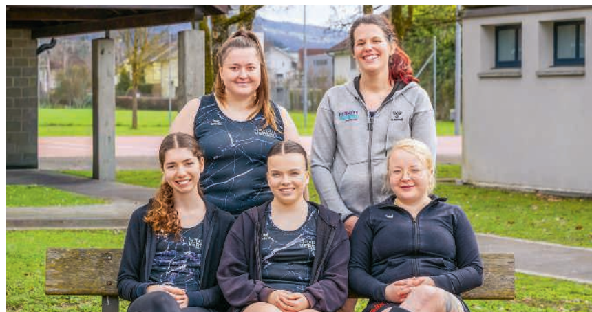
Mit dem 3. Rang an der Netzballeisterschaft Region Nordschweiz haben sich die Netzballerinnen für die Schweizer Meisterschaft qualifiziert

Damit qualifizierte sich das Team für die Schweizer Meisterschaft vom 10. Mai in Windisch - organisiert vom Sportverein Birmenstorf. Alle Fans und solche, die es werden wollen, sind aufgerufen, die Netzballerinnen lautstark zu unterstützen. Weitere Infos folgen auf svbirmenstorf.ch.