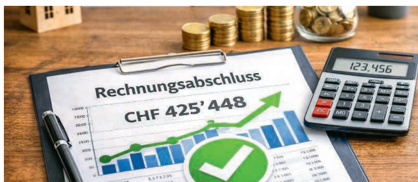
Statt des erwarteten Verlusts resultierte 2025 ein Plus

Grund für den guten Abschluss ist, dass in vielen Bereichen die budgetierten Ausgaben nicht vollumfänglich getätigt wurden. Als Beispiel kann der Unterhalt für Gemeindeliegenschaften genannt werden, bei dem rund 32 000 Franken weniger als budgetiert aus-