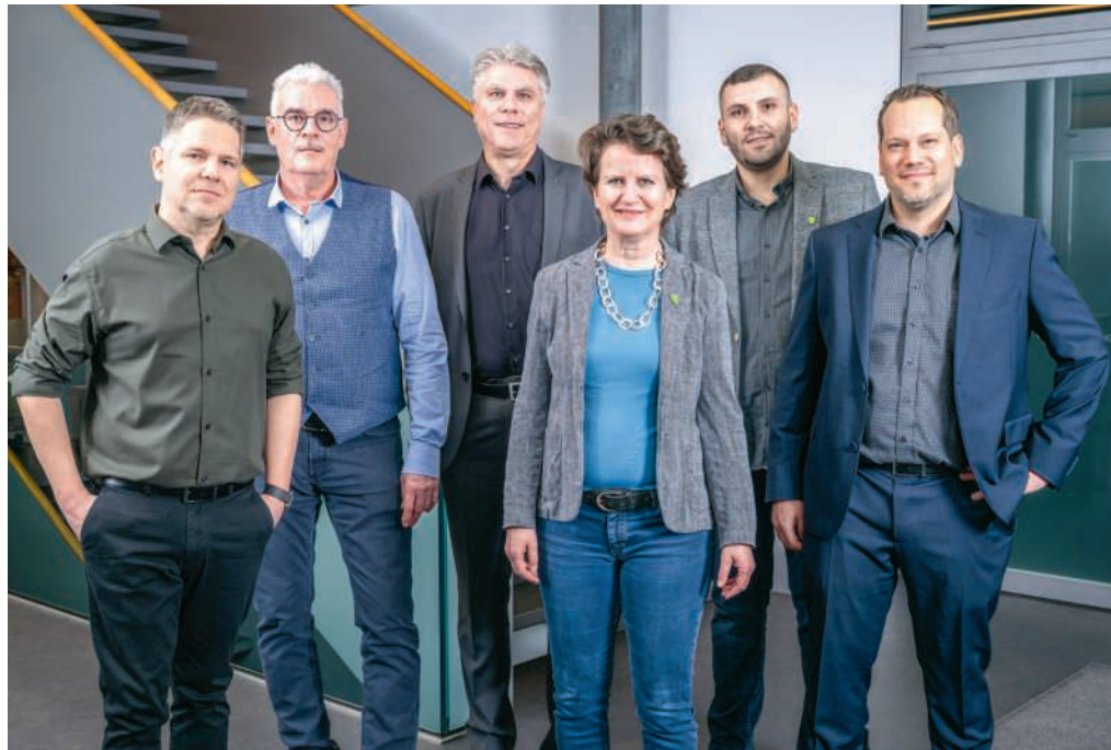
Der neu zusammengesetzte Gemeinderat hat die Legislatur- und die Jahresziele festgelegt

Die gebührenfinanzierten Gemeindewerke Strom, Wasser, Abwasser und Abfall sind eine zentrale Aufgabe der Gemeinde. Die Regulierungen und Anforderungen an die Werke steigen jährlich. Der Gemeinderat hat sich die Klärung der Zukunft und die Ausrichtung sowie die Stabilisierung der Gemeindewerke zum Ziel gesetzt. Zudem wird an der Sicherstellung der Wasserqualität und an der Wasserversorgungssicherheit gearbeitet, indem mitunter eine Ringleitung nach Mülligen geprüft wird.