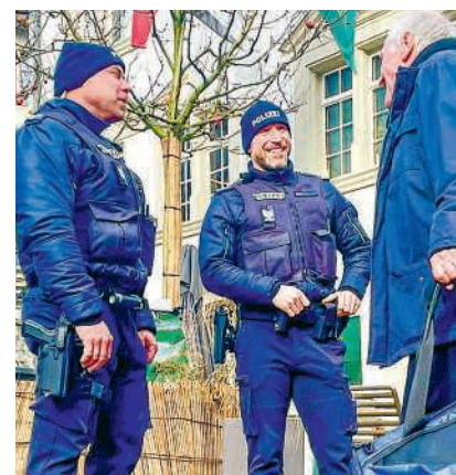
Stadtpolizisten im Einsatz

Gegenüber 2024 hat die absolute Anzahl an Geschwindigkeitskontrollen abgenommen: 22 Mal wurde in Birmenstorf im vergangenen Jahr gebüsst - 6 Mal davon mit semistationären Messgeräten. Dabei wurden 6945 Geschwindigkeitsübertretungen festgehalten, im Jahr davor waren es noch über 8600. Den offiziellen Geschwin-