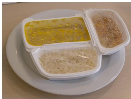
Angebot Pro Senectute Aargau

Ein Mal pro Monat wird in verschiedenen Gemeinden ein Mittagstisch organisiert. Das Programm und Informationen erhalten Sie bei Pro Senectute Aargau, Beratungsstelle Bezirk Baden, Telefon 056 203 40 80