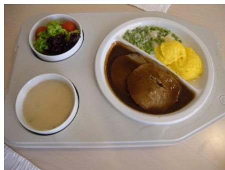
Angebot AZ am Buechberg

In der Cafeteria des AZ am Buechberg. CHF 17.00 (inkl. Mineral), mind. 3x/Woche. Vorgängige Anmeldung notwendig.