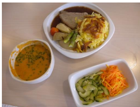
Angebot AZ im Grüt

In der Cafeteria des Alterszentrums. Es stehen verschiedene Menüs zu unterschiedlichen Preisen zur Auswahl. Vorgängige Anmeldung nicht nötig.